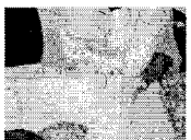
Sistema de Aquecimento que está sendo instalado nesta semana na Emei Irmã Lúcia Preocupada em mobilizar cada ...