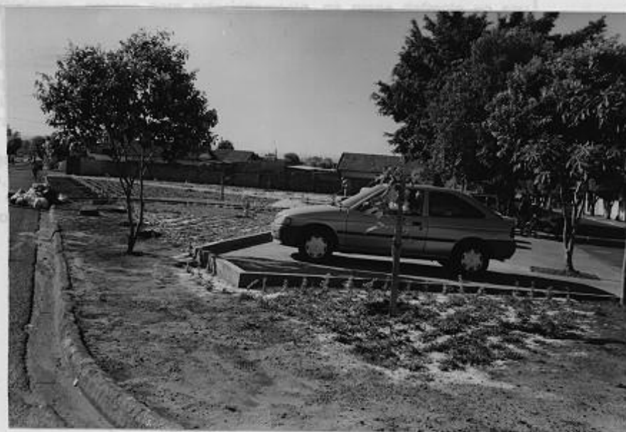
RUA JOÃO LOPES

Desta forma, julga-se esta boa praça de contra-partida que atende como