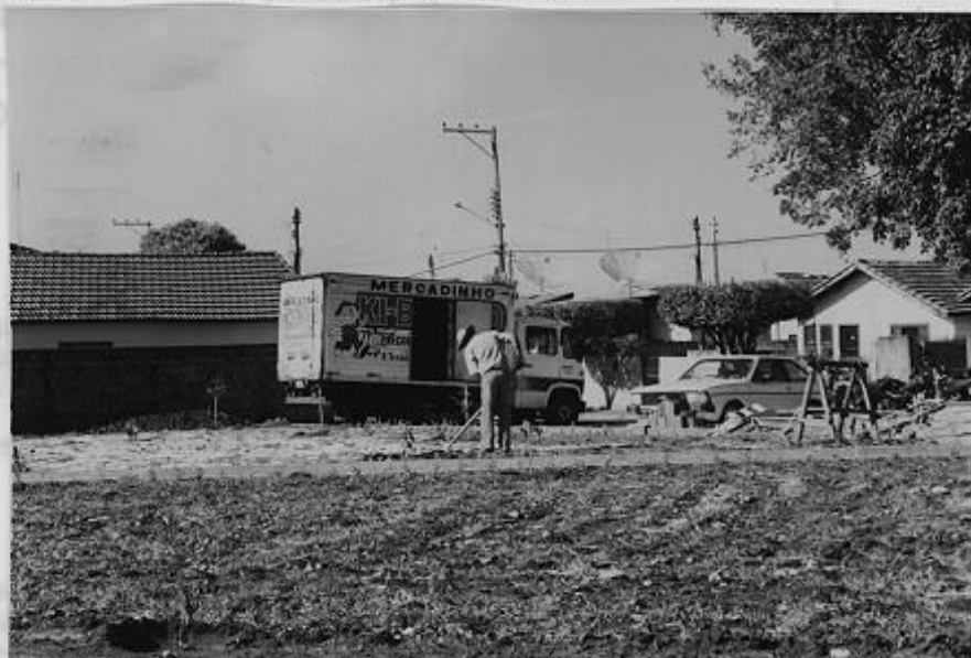
RUA VER. RICARDO PELLIZER

Os proprietários do Mercadinho Ki-Barato, situado na rua José Ricardo Pellizer, nº 55, no Conjunto Antonio Pertinez, mais conhecido como Fercon, têm utilizado, com autorização da Prefeitura Municipal, a praça para fazer o comércio.