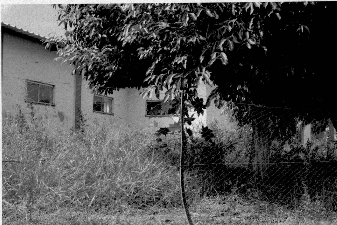
Matagal tomando conta do prédio.