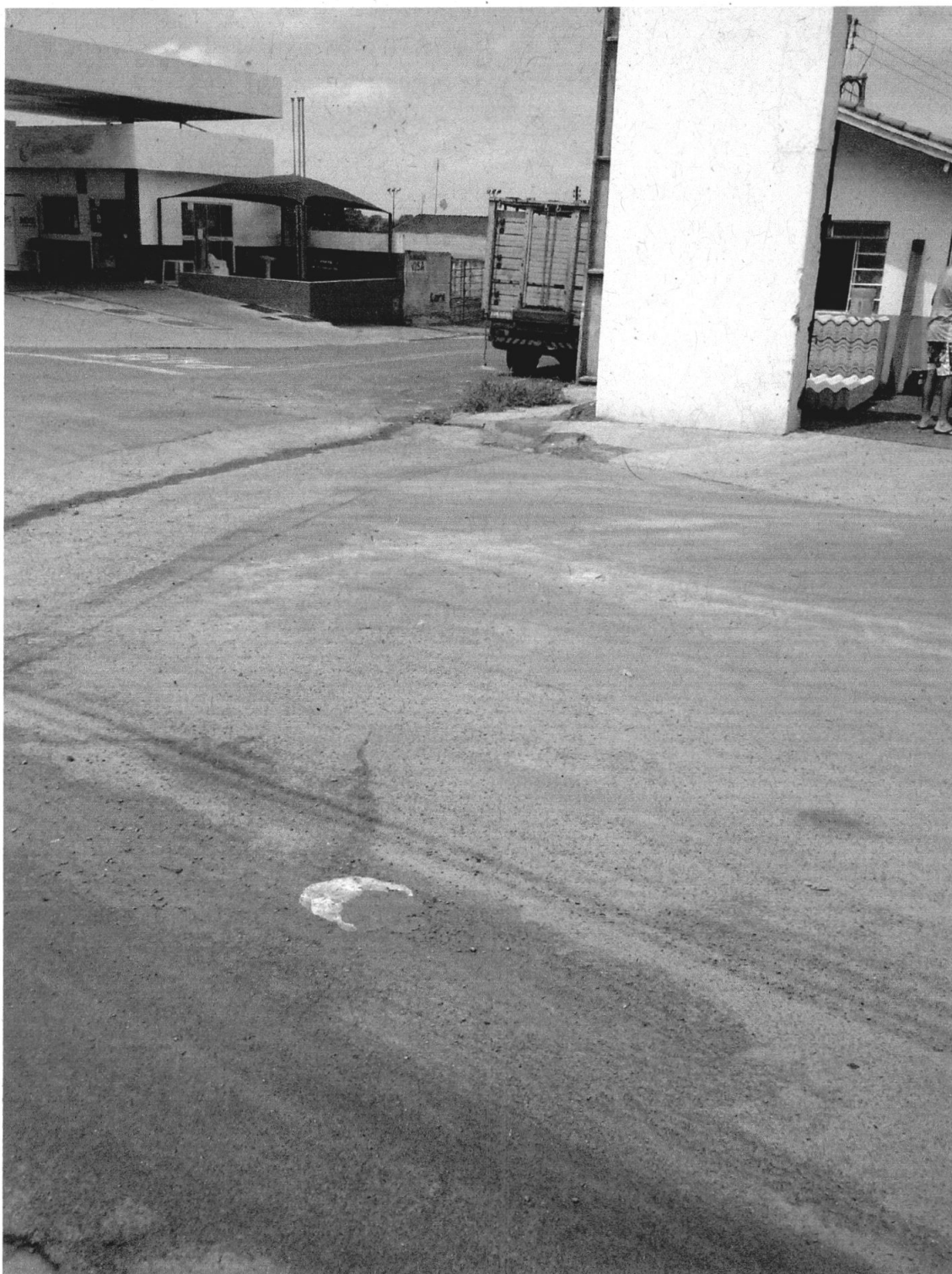
Visão da rua 7 sentido bairro x centro.