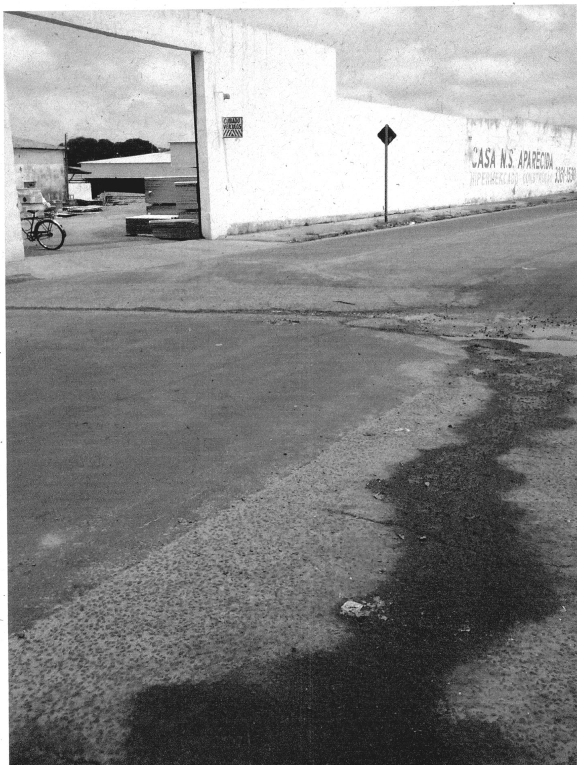
Notória a falta de pintura no solo que sinalize melhor o local.